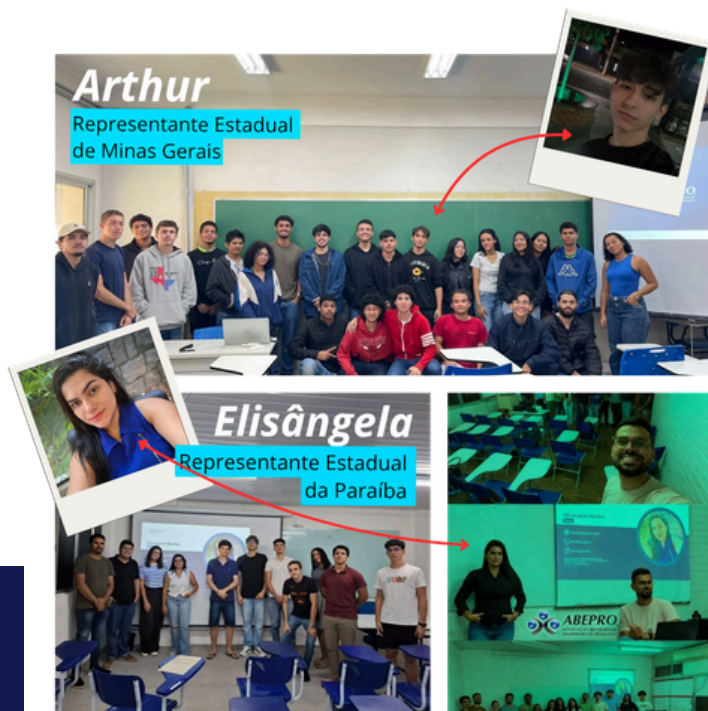
Apresentações institucionais destaques

Agora, resta confiar no esforço depositado e aguardar. Aproveite as próximas semanas para recarregar as energias e focar nas demandas de fim de semestre. Nos vemos no ENEGEP!