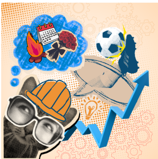
A Engenharia de Produção em meio às comemorações do mês de Junho.

Namorados, Copa e Festa Junina juntos no mesmo mês? Para dar conta de tudo isso, é pura Engenharia de Produção