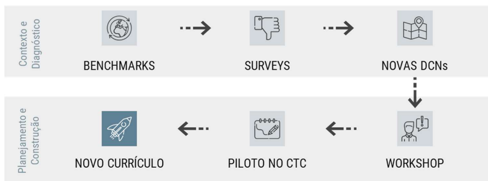
Figura 1. Metodologia para a reforma curricular do curso de Engenharia de Produção da PUC-Rio

O novo currículo de Engenharia de Produção foi concebido seguindo uma metodologia composta por duas etapas que se desdobram cada uma em três passos, conforme apresentado na Figura 1.