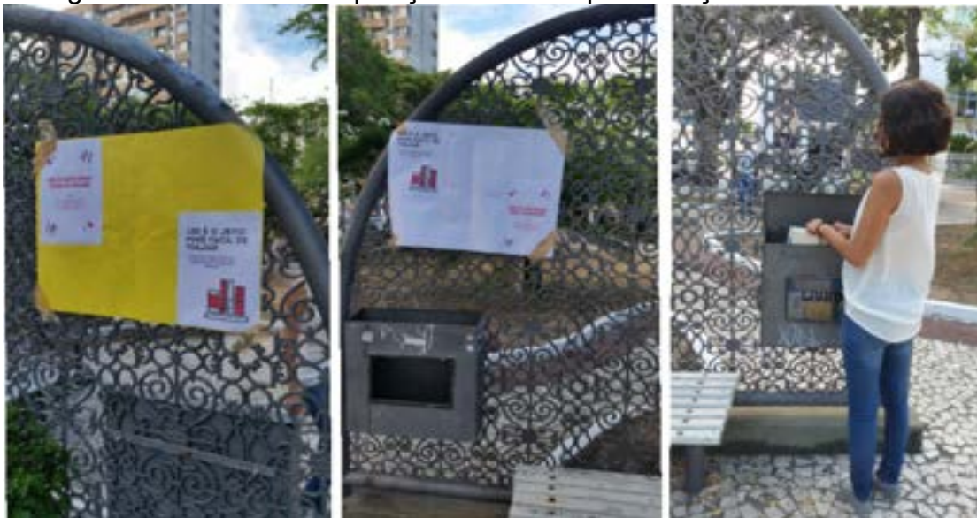
Figura 04 - Pontos de exposição dos livros para doação aos interessados