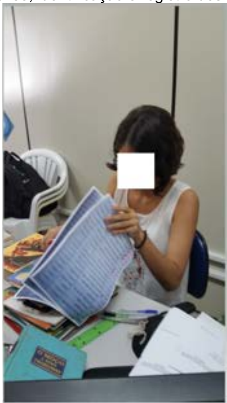
Figura 02 - Análise, identificação e registro dos livros recebidos